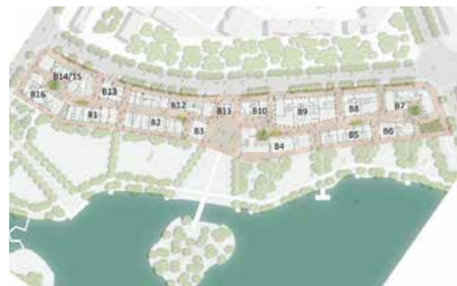
Lageplan der hannoverschen Straße.

Allgemeine technischen Daten und Funktionen.