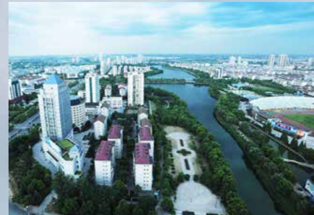
Changde ist eine grüne Stadt und am Wasser gelegen.