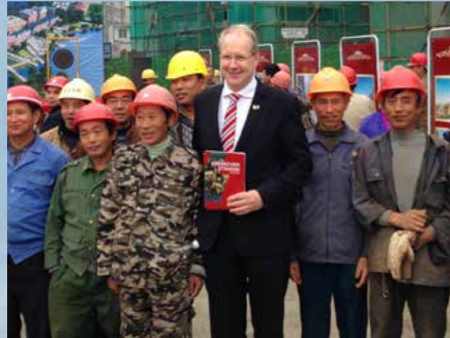
Oberbürgermeister Stefan Schostok mit Bauarbeitern auf der Hannoverschen Straße.