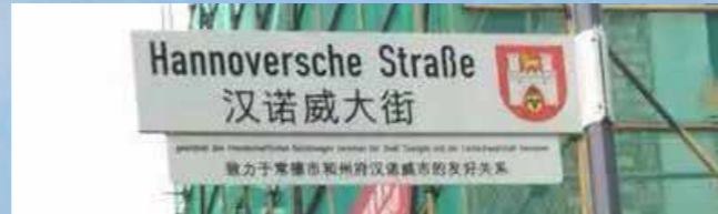
Straßenschild: Eingeschenk von der Stadt Hannover.

Die „Hannoversche Straße“ ist ein Symbol der Wertschätzung der langjährigen Freundschaft zwischen Hannover und Changde. Das neue deutsche Viertel mit der „Hannoverschen Straße“ als Hauptanlaufpunkt ist ein kleines, eigenständiges Quartier im nördlichen Zentrum Changdes. Die Straße führt direkt zum Chuanzi Fluss, der das nördliche Zentrum begrenzt. Ziel der Städteplaner ist es, mit einer bunten Mischung aus Wohnungen, Büros, Restaurants, Cafés und Geschäften ein lebendiges internationales Viertel zu etablieren. Dabei stellen Filialen authentischer deutscher Unternehmen ein wesentlicher Erfolgsfaktor dar. Die unmittelbare Nähe von pulsierendem Leben einer Metropole und beruhigendem Einfluss der Natur macht das Viertel um die „Hannoversche Straße“ zu einem attraktiven Ziel für Unternehmer und Touristen.