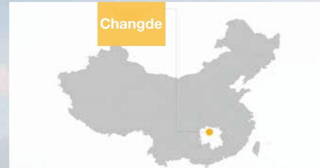
Changde liegt in der Provinz Hunan in Mittelchina.