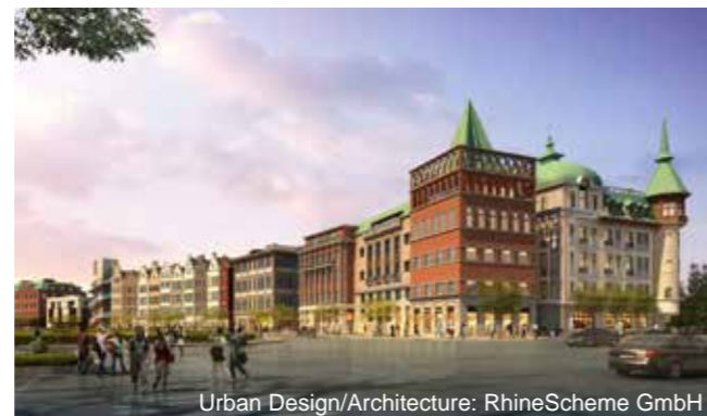
Urban Design/Architecture: RhineScheme GmbH Nordende des Stadtquartiers mit den Türmen des Grand Hotels und des Kontorhauses (Rendering Version)