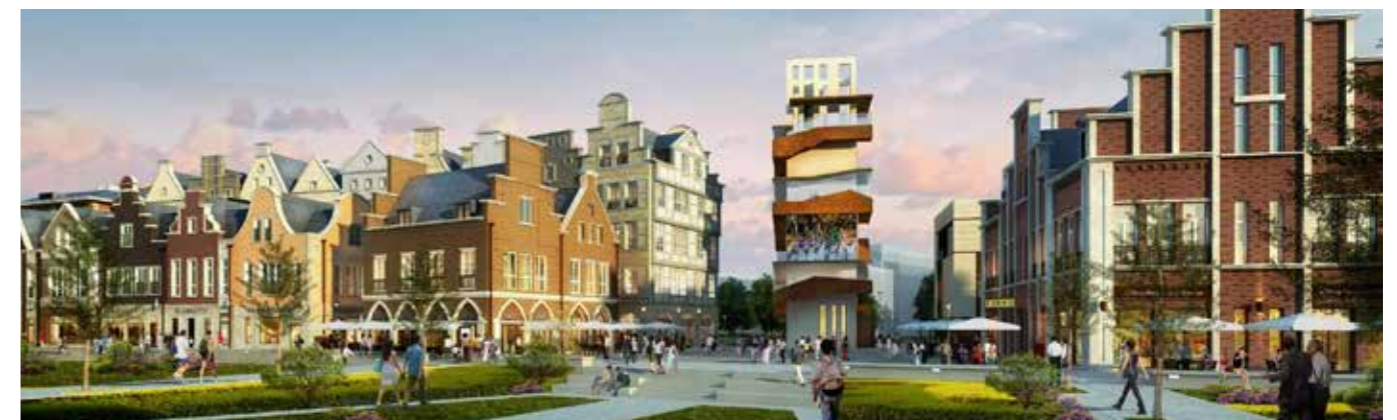
Hannover-Platz mit Aussichtsturm und Gaststätten an der Uferpromenade (Rendering Version)