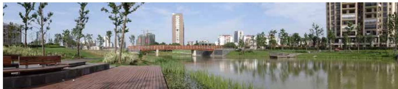
Gewässersanierungsprojekt Chuanmatou (Teil Chuanzi Fluss) durch Wasser Hannover GmbH/e.V. von chiyan.