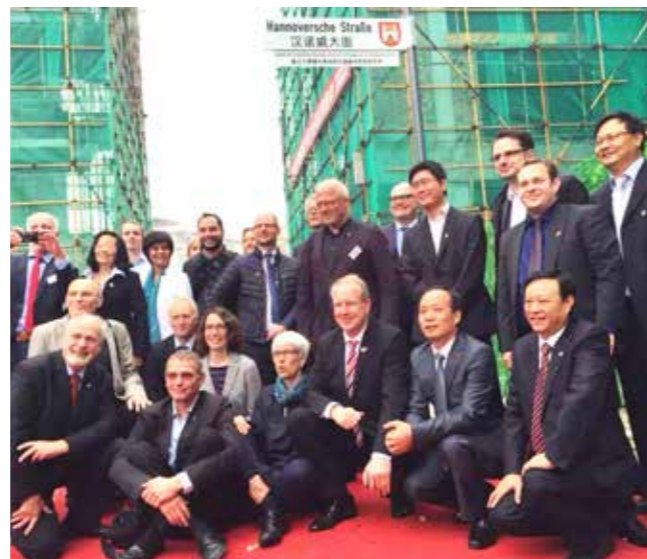
Enthüllung des Straßenschildes. Gruppenbild der Hannoverschen Delegation aus Politik, Verwaltung und Wirtschaft mit Oberbürgermeister Derui Zhou der Stadt Changde.